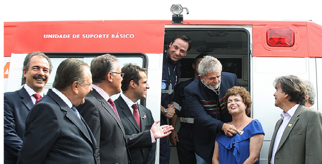
O Presidente Lula, a Ministra Dilma Russeff e o Ministro José Gomes Temporão em uma das ambulâncias